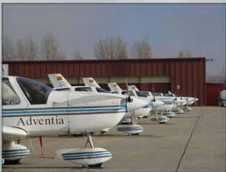
EADS Socata Tobago TB-10