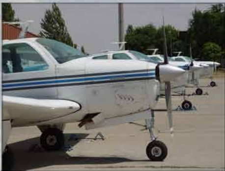
Beechcraft Bonanza F-33