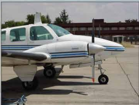
Beechcraft Baron B-55